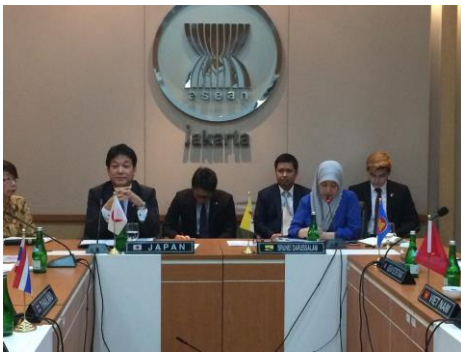
▲アセアン事務局での講演