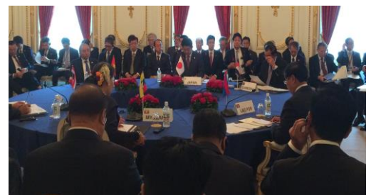
▲日メコン首脳会議