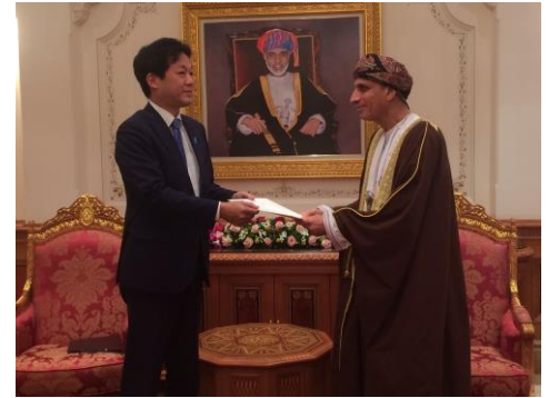
▲オマーン副首相へ総理親書お渡し