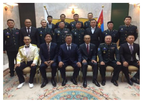
▲モンゴル、大使公邸でのレセプション