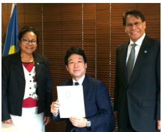
パラオ・マルグ国務相

太平洋の島諸国は、比較的新しい独立国が多く、各々が島特有の困難な課題を抱えておりますが、日本は兼ねてより各々の国の事情を踏まえた協力や援助を行ってきました。多くの島諸国は国連はじめ 国際社会の様々な場面で日本の立場を理解し支援している重要な国々です。 特に近年は海洋における法の支配や安全保障分野における協調関係を築く上で重要性は益々高まっております。 5月18日・19日に日本で開かれる太平洋島サミットの準備として、ソロモン・パプアニューギニア・オーストラリア・ミクロネシア等を歴訪し、各要国要人との会談を行って参りました。