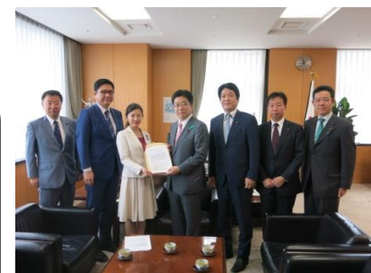
〈加藤一億総活躍大臣へ中間報告提出〉