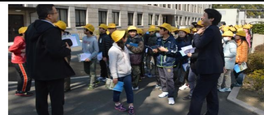
〈議事堂内を案内している様子〉

今後も開催していきますので、ぜひお気軽に詳しい内容等を事務所までお問い合わせください！！