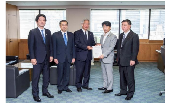
〈田村厚労大臣に申し入れの様子〉