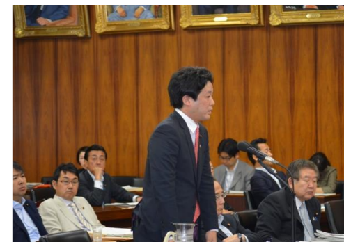
〈外務委員会質疑の様子〉