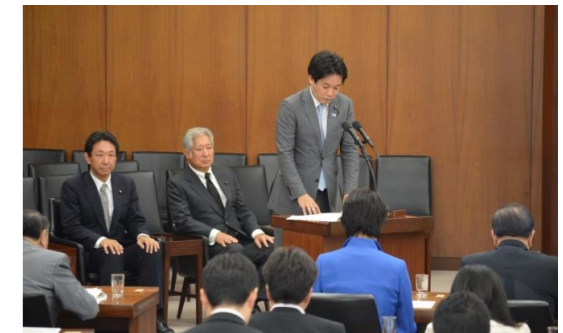
〈厚労委員会にて趣旨説明をしている様子〉