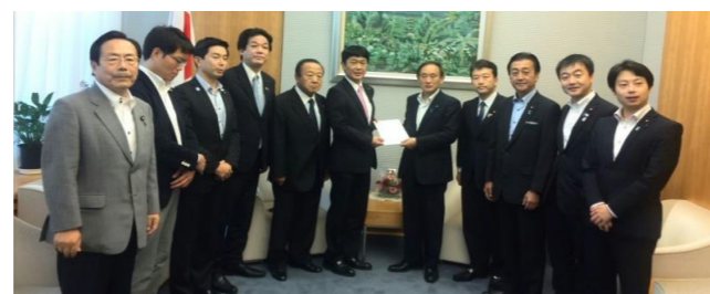
〈菅官房長官に要望書提出の様子〉