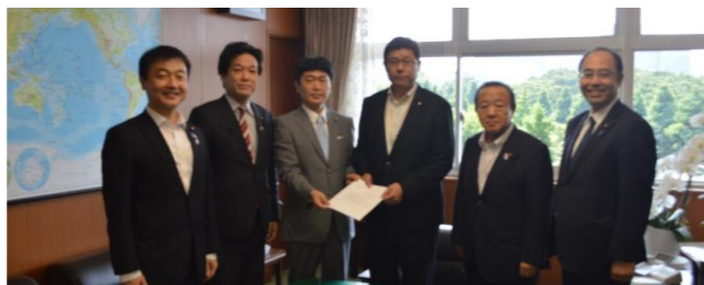
〈高木国交副大臣に要望書提出の様子〉